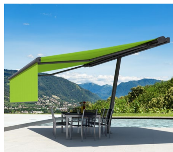
En option, pour plus de confort: lambrequin markilux.