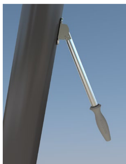
Rotatif en version «markilux planète flex» jusqu'à 335°.